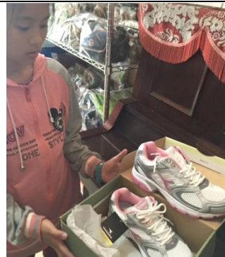
開學前孩子拿到新的運動鞋，心滿意足