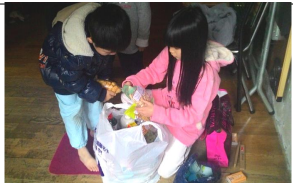
挨餓的孩子們開心接收愛心物資~