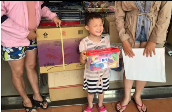
炎熱夏天，孩子領到涼風扇開心的笑著