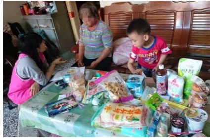
將食物箱宅配到府，用心傾聽、關懷家戶近況