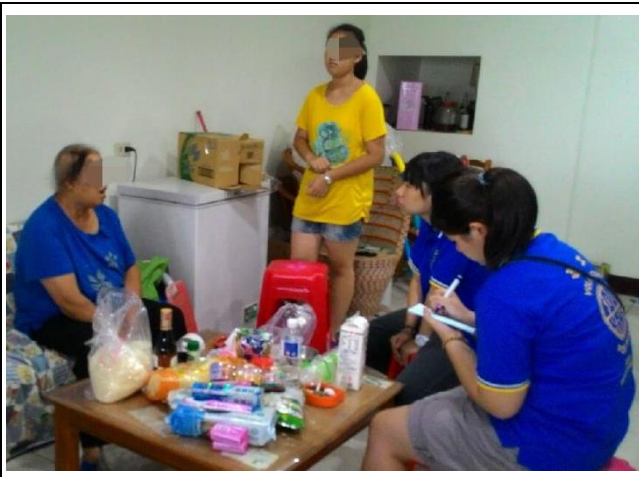
訪視志工做家況調查，評估其實質需求