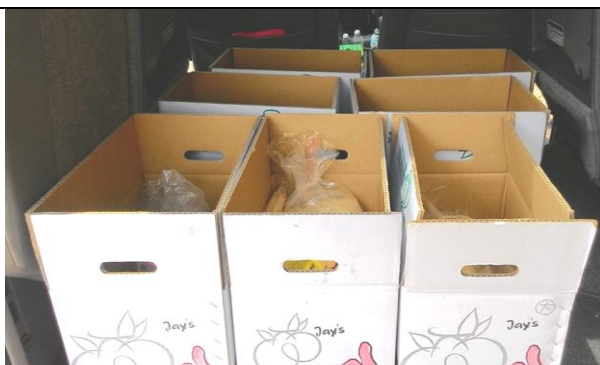
公務車載滿食物箱，準備為愛出發！