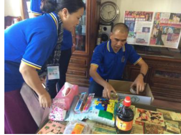
志工將溫馨食物箱配送至受扶助家庭~