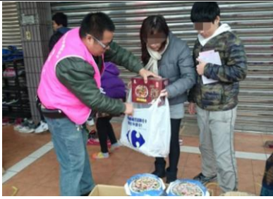
愛的分享日，發放年菜讓清寒家戶也能過好年