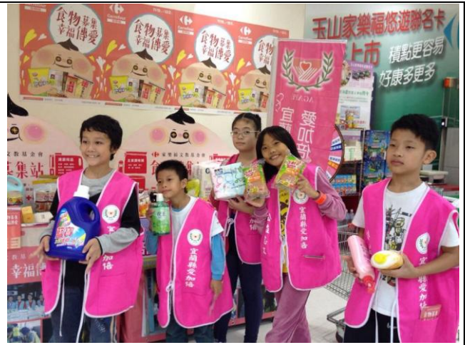
小志工幫忙宣傳，食物募集、幸福傳愛