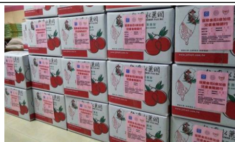
裝箱完的食物箱，將送到清寒家庭給予生活補充